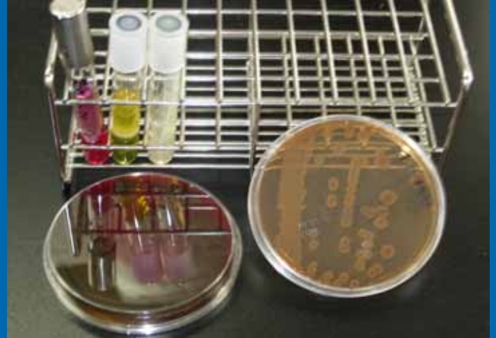
寒天培地に発育したグラム陰性桿菌の集落