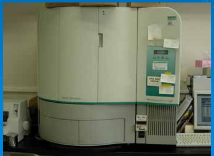
細菌自動測定機器