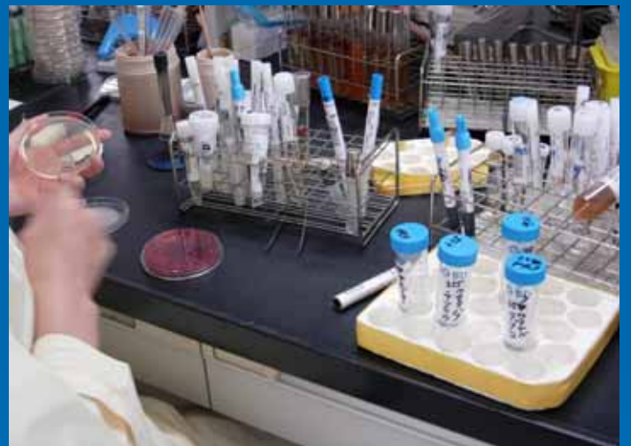
種々の検査材料を培地へ塗布