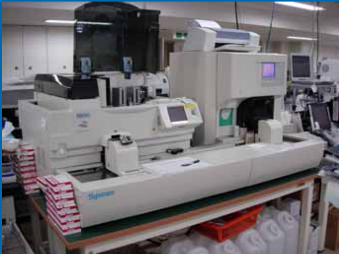
全自動血球計数装置

血液検査・・・血液中の白血球・赤血球・血小板に貧血・白血病といった異常がないかを調べます。