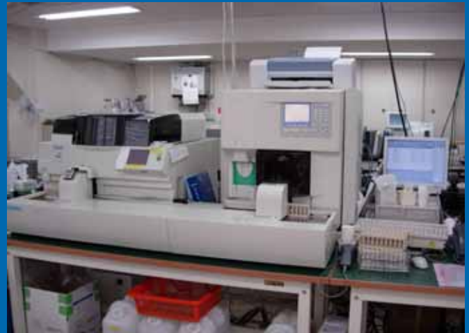
全自動血球計数装置