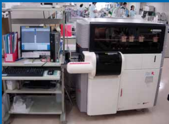
凝固因子測定装置