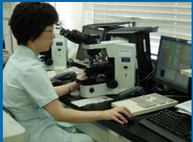
顕微鏡による血液像検査