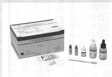
クロストリジウム デフィシル検査キット