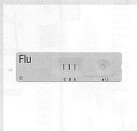
インフルエンザ検査キット