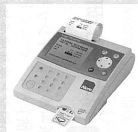
心筋・胸痛マーカー簡易迅速測定装置