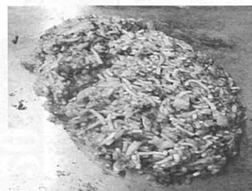
やきめし(そばめし)