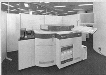
生化学自動分析装置 JCA-BM6010