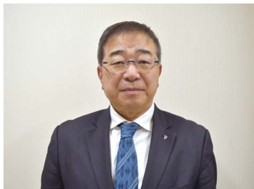
兵庫県医師会会長 八田昌樹先生