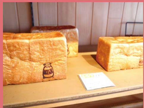
焼き立てのみるくパン (1斤¥530・1.5斤¥800)

今回ご紹介するのは牛乳屋のパン屋さん【みるく村808】です。神戸電鉄粟生線・市場駅より徒歩約10分、北播磨総合医療センターからは車で約5分の所にあります。店内には食パンはもちろん菓子パンや惣菜パンと種類多く並べられ、来店するたびに新しいパンと出会えます。無添加&国産小麦と牛乳を使用したパンはとても柔らかく、生地にはほんのり甘みを感じられます。オススメは金曜・土曜限定の【みるくパン】です。水を一切使わず、那須高原で育った牛の牛乳100%で作られた食パンはミルクの優しい風味が特徴です。またこちらも金曜・土曜限定で【源ちゃんのケーキ】が販売されています。一番人気の牛乳たっぷりのバスクチーズケーキは、濃厚なのに癖がなく大きめのサイズですがペロリと完食してしまいます。その他には、注文が入ると同時にクリームを詰めてくれるクッキーシューの【アポロ】や季節の果物を使ったケーキやタルトも並んでいます。(写真にはないのですが、秋季に販売されていた栗たっぷりのモンブランが私の一押しです!)販売されるケーキの種類は日によっても異なるためお店のInstagramを確認してご来店ください。数に限りがあるため売り切れてしまうこともあります。お取り置きや北播磨地域(小野市・三木市・加東市・加西市の一部・加古川市の一部)では配達も行っているそうなので近隣の方は是非ご活用してみてください。北播磨地域にお越しの際は、是非立ち寄ってみてはいかがでしょうか。