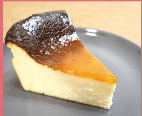
一番人気のバスクチーズケーキ (¥420)