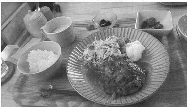
ハンバーグランチ

営業時間は、7:00～17:00（定休日：金曜日）で、残念ながら、ディナーはされていませんが、山々に囲まれる神河町は、峰山高原や砥峰高原では、これからススキや紅葉が見ごろです。冬には、雪景色が楽しめることもあります。お近くに寄られた際は、是非、こちらのお店にも立ち寄って、ほっと一息つかれてはいかがでしょうか？