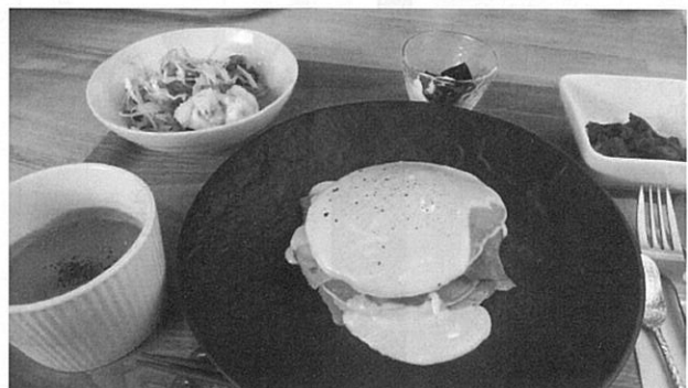
チーズメルトパンケーキランチ