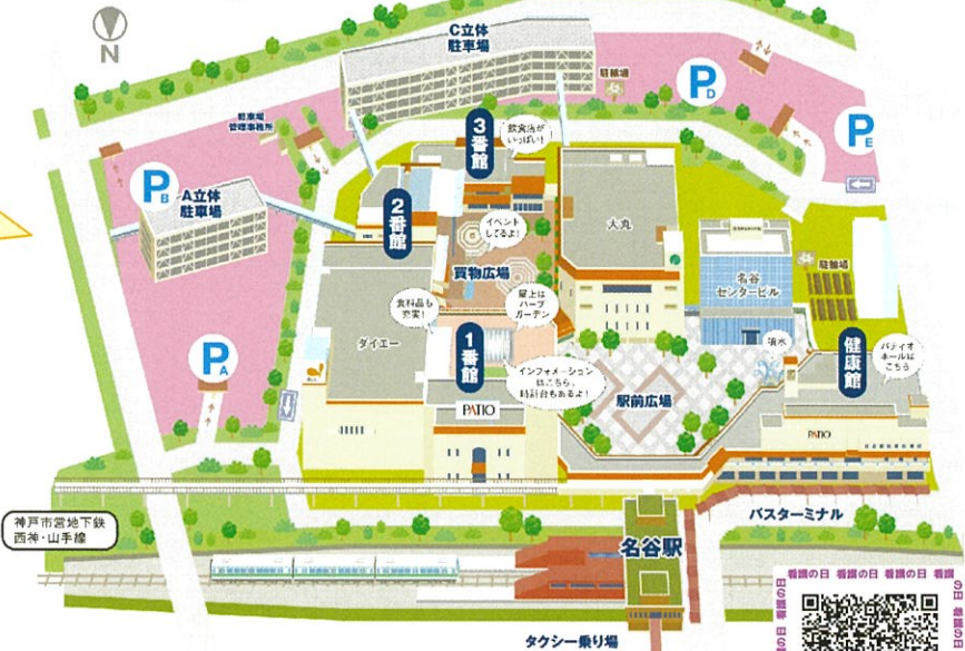
須磨パティオ全体図

看護の日とは、 フローレンスナイチンゲールの 誕生日にちなみ、5月12日 「国際看護師の日」と定められています。